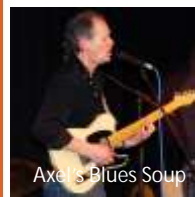
Axel's Blues Soup